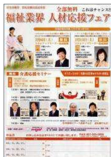
お芝居+シンポジウム

目的： 演劇 の効果を利用して、無理なく 介護職 の魅力を伝え、 介護職への 就労を促進 する。介護の職場環境の改善推進と 介護職に対する地域の理解・協力を 啓蒙啓発 する。