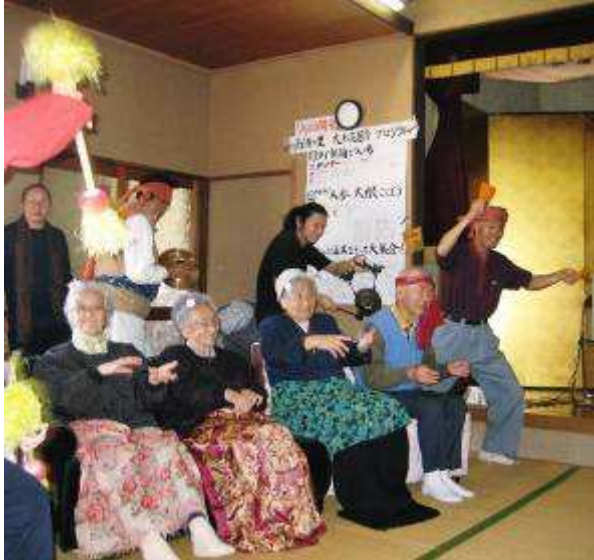
デイサービスの高齢者も出演↑