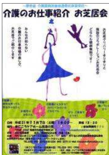
介護紹介お芝居会