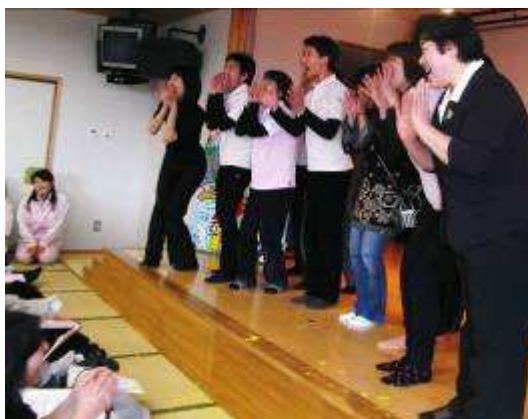
←介護スタッフによるお芝居「人参大根ごぼう」