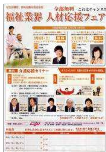
お芝居+シンポジウム

目的： 演劇 の効果を利用して、無理なく 介護職 の魅力を伝え、 介護職への 就労を促進 する。介護の職場環境の改善推進と 介護職に対する地域の理解・協力を 啓蒙啓発 する。