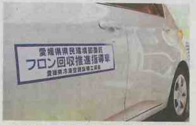
愛媛県の冷凍空調設備工業会は、車に啓発ステッカーも貼って関係業界を回った(松山市で)

にエアコンの廃棄を依頼した建物の所有者は、「きちんと回収してくれると思った」などと話した。