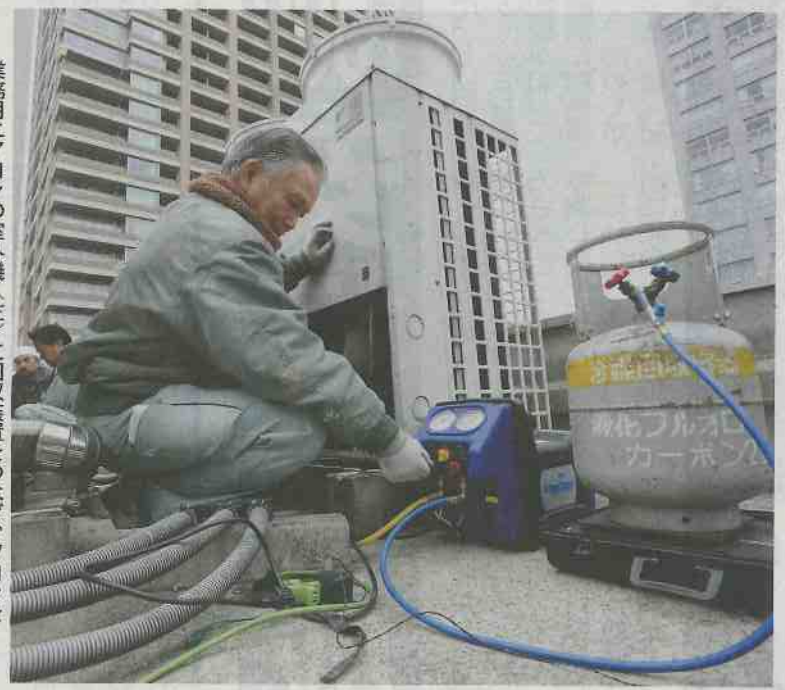
業務用エアコンの室外機(左)に回収装置をつなぎ、フロンをボンベに回収する(3月30日、東京都内)